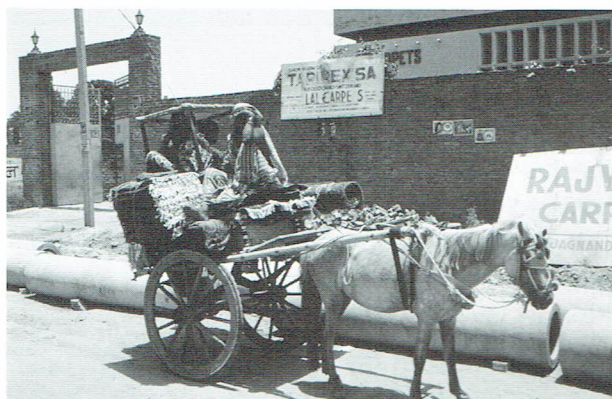
Så här kan det se ut när en last Kinnasandsmattor lämnar väv-byen för den långa resan till Sverige.