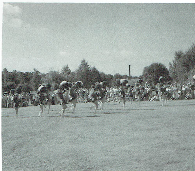
Drillflickornas uppvisning inför en livligt applåderande publik