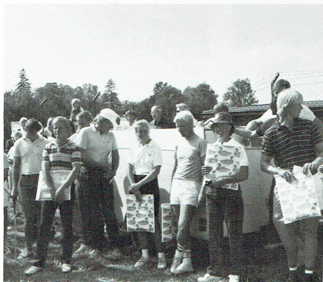
Deltagande golfspelare fick ett stort anskuvert med Kinnasandsinformation