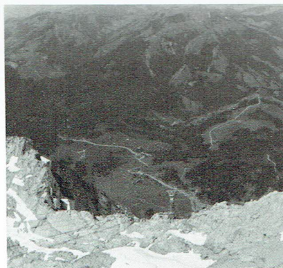
Utsikt från Säntis topp

Nya äventyr väntar. Bergsklättring står på programmet. Tidigt en morgon startar vår buss för färd längs Bodensee via städerna Romanshorn, Arbon (vävstolar), Rorschach upp mot St. Gallen, gammal vacker stad, vidare genom Appenzell upp till Säntis-toppen, 2504 mtr. högt. Här upp blåser det friskt och