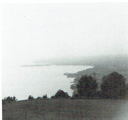
Landskapsbild från Rhen

Om någon har fler bilder från festen — hör av Er till Kinnasandsbladet. Red.