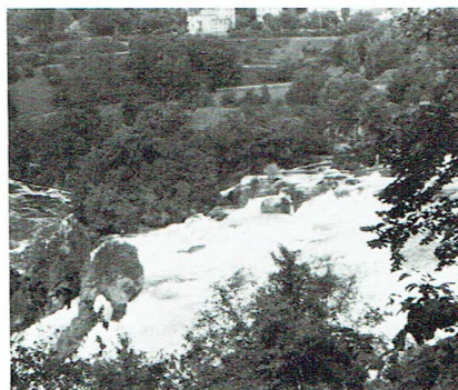
Rheinfall vid Schaffhausen

sen, längre ned kommer vi inte, det mäktiga Rheinfall stoppar oss med sin fräsande och virvlande häkkittel och vi får ta buss tillbaka till vårt utgångsläge Kreuzlingen.