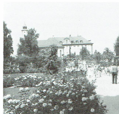
Partier av parkanläggningen, Mainau

Så här i sommarens elfte timme, kommer man naturligtvis att tänka på den sommar som vi upplevt, som en av de allra varmaste på mycket länge. Till fromma för alla bad- och soldyrkare. Seglare och vindsurfare icke att förglömma. Men att semestera vid "Europas hjärta" var något av en tropisk upplevelse. En värmechock, som vi inte är vana vid, som kommer från Höga Norden. Det glömmes man dock snart, ty en rundvandring på de gröna öarna i Bodensjön, Mainau och Reichenau, är som en enda lång botanisk lektion. Ett eldorado för alla blomstervänner är utan tvivel Mainau, med slottet och den stora parkanläggningen, där