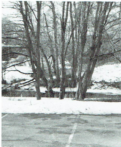
Snösmältning mars 1982

nade vi. Tungt var det att leva under dessa år på grund av krigsläget ute i Europa och vi skyllde de stränga