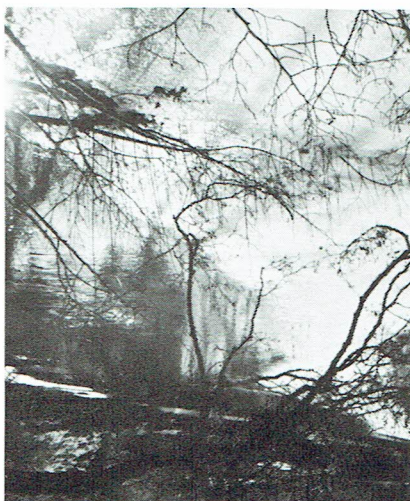
Islossning mars 1982

Nu har vi vårdagsjämningen här och så skall enligt almanackan våren vara på väg så sakteliga, även om dagarna är grå och solen lyser med sin frånvaro just nu. Vårtecknen är inte att ta miste på: snödropparna lyfter försiktigt sina huvuden, krå-