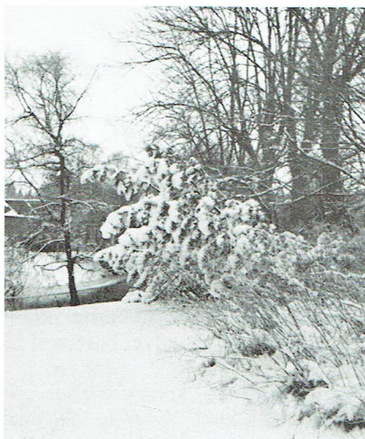
Kall och solig januaridag 1982

Men medan vi frös både ute och inne, så hade sport- och konfektionsaffärerna gyllene tider med försäljning av täckkappor, skidor, skridskor och annat, som skulle passa till både julklappar och den kommande vintersportsäsongen. Jul- och nyårshelg blev precis så vit och fin, som vi hade drömt om eller som vi vanligen ser på Jenny Nyström-julkort.