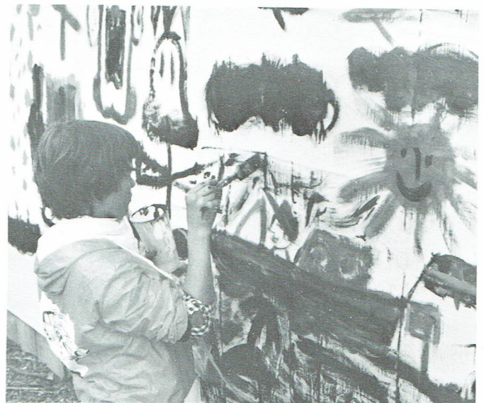
Kreativa arkitektbarn ger idéer till ny design.