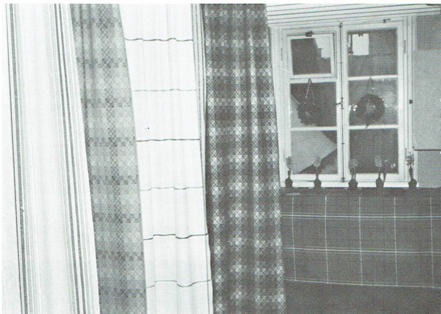
Interiör från Funchens gränd