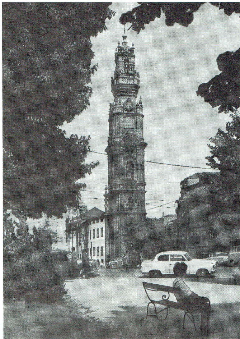
Clérigos-tornet, Porto's mest berömda byggnad

Någonting som däremot var mycket bra var vädret. 20 grader varmt och strålände solsken. Det var en chock att komma hem till vårt kalla klimat igen.